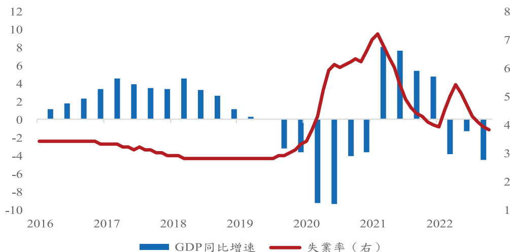
圖 1：香港經濟增速與失業率 (%)