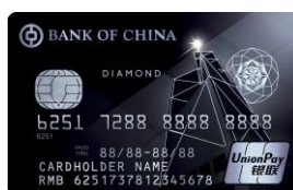
「亮起来」银联双币钻石卡 (胶卡)

中银银联双币钻石卡 1 (有关卡面请见上图)之「本地签账3X积分奖赏」将于2018年12月31日结束，而2018年12月合资格签账交易所获得之额外「2X」签账积分将于2019年1月下旬或之前志入合资格信用卡账户内。由2019年1月1日起，主卡及其下所有附属卡之本地签账交易将不获额外「2X」签账积分。仅此通知。