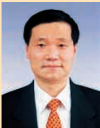
肖鋼 中國銀行股份有限公司、 中銀香港(控股)有限公司及 中國銀行(香港)有限公司董事長

本人謹此報告，截至2004年12月31日止年度，本集團共錄得股東應佔溢利119.63億港元，同比增加50.23%，其中撥備淨撥回為16.28億港元，物業重估升值為18.62億港元。本年度經營收入為158.57億港元，同比下降8.09%，主要是因為淨利息收入下降13.06%，而淨服務費及佣金收入的增長部分抵銷了淨利息收入的下降。每股盈利1.1315港元（2003年每股盈利為0.7532港元）。