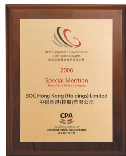
本公司榮獲香港會計師公會主辦的2006年「最佳企業管治資料披露大獎」的「評判嘉許獎」，以表揚本公司致力提升企業管治及資料披露水平