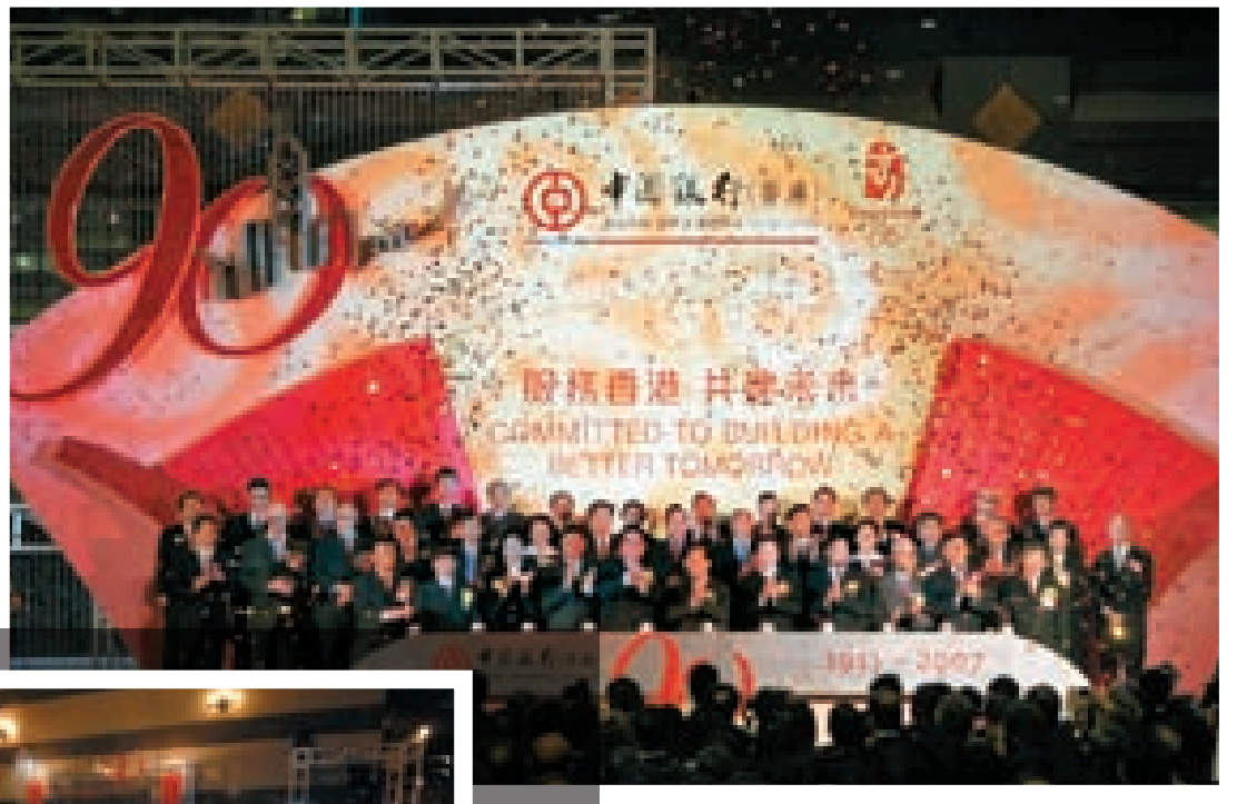
在90週年慶祝酒會上，肖鋼董事長（第一行右五）聯同香港特別行政區行政長官曾蔭權（第一行中間）、中央政府駐港聯絡辦公室主任高祀仁（第一行左五）及眾主禮嘉賓一同主持亮燈儀式。