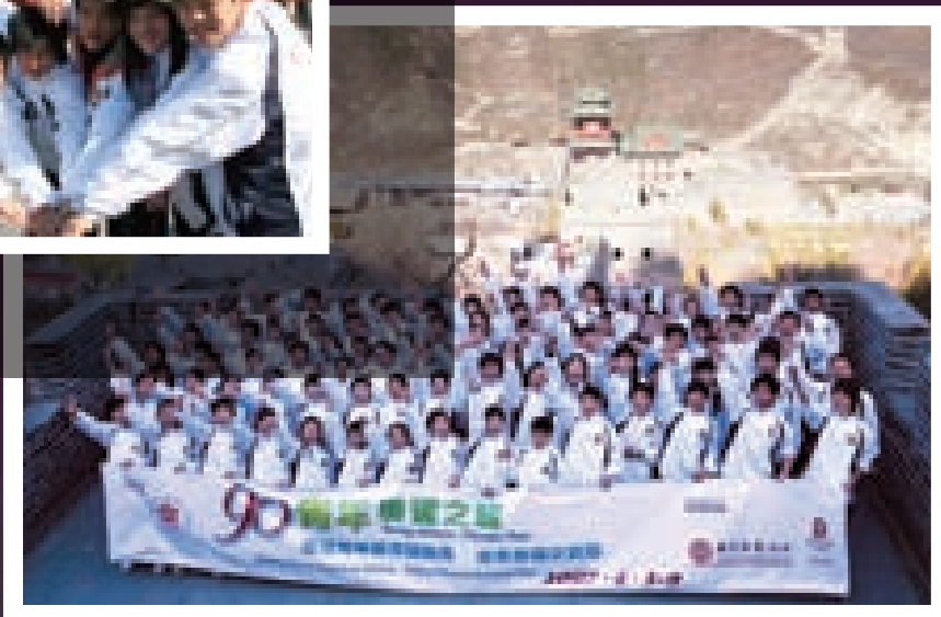
我們贊助的「90青年奧運之旅—香港優秀青年運動員北京奧運交流團」，讓香港青年運動員有機會親身了解國家體育事業的發展。