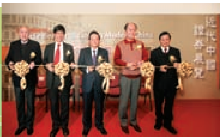
我们赞助「近代中国证券展览」，加深市民对中国证券发展的知识