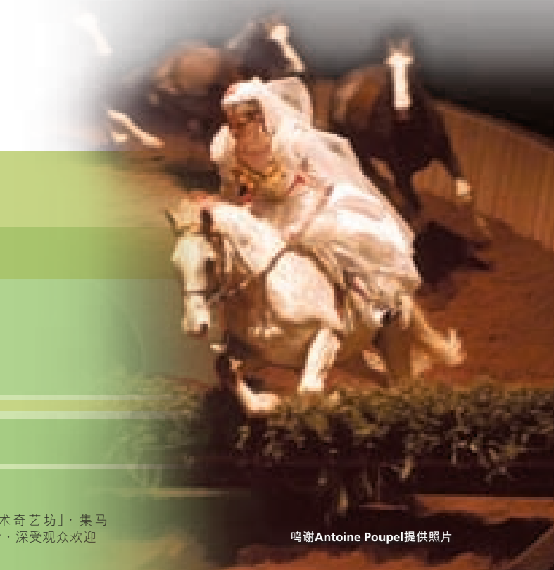
享誉全球的「星跃马术奇艺坊」，集马术、歌剧及舞蹈于一身，深受观众欢迎