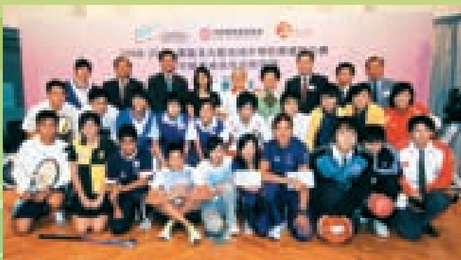
我们赞助学界运动会，积极支持青少年体育发展

基金在教育及培养年青一代方面不遗余力。为表扬成绩优秀的同学及资助经济有困难的学生，基金在本港各大学和专上院校设立奖、助学金。自1990年以来，基金累计颁发的奖助学金逾港币1,138万元，受惠学生1,194人。