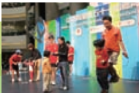
我们积极支持多项与北京奥运会有关的项目，如赞助「中银香港体育节」，推广全民运动的健康生活方式

基金积极推广「全民运动」的信息，连续第三年冠名赞助「中银香港体育节」，各体育总会在为期4个月内举办