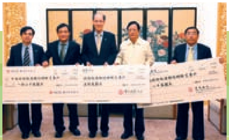
集团及时捐助四川地震灾民，以济其燃眉之困