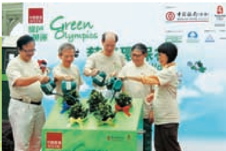
我们特别举办集奥运、环保及慈善于一身的创新步行活动「绿色奥运－慈善环保行」

在推动环保方面，集团与香港生产力促进局携手推出「环保易机器融资优惠计划」，帮助中小企业添置合符环保原