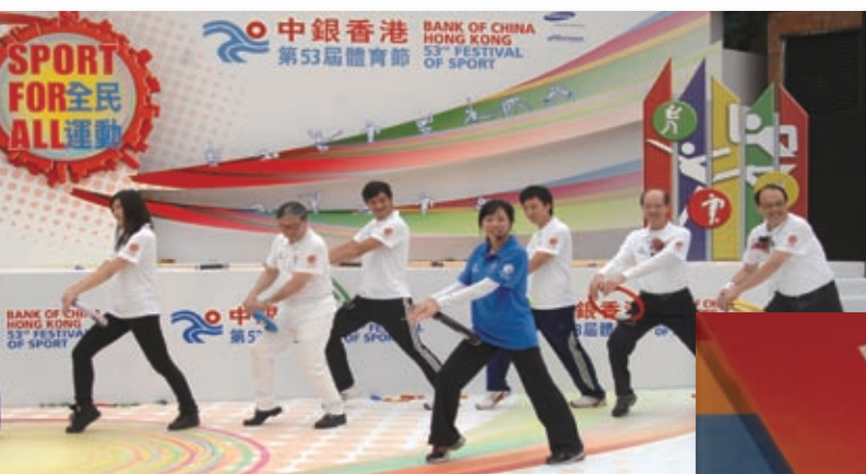
連續4年贊助「中銀香港體育節」，推動「全民運動」。

為支持香港體育發展，中銀香港捐贈港幣1,000萬元予中國香港體育協會暨奧林匹克委員會及其屬下的「香港運動員就業及教育計劃」。