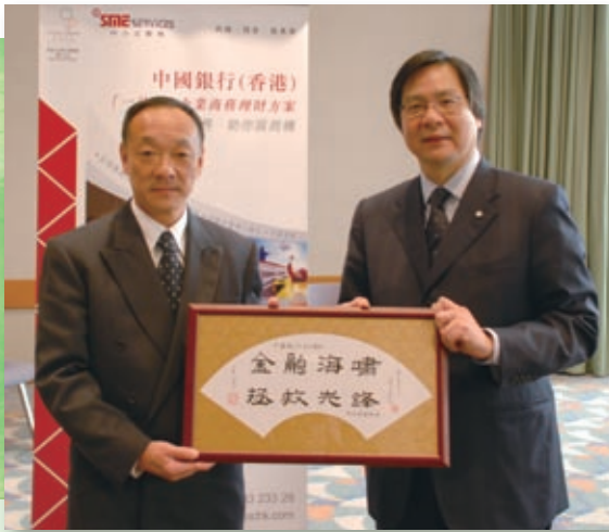
本集團全力支持經營穩健的中小企業客戶，協助他們克服金融危機下的經營困難。