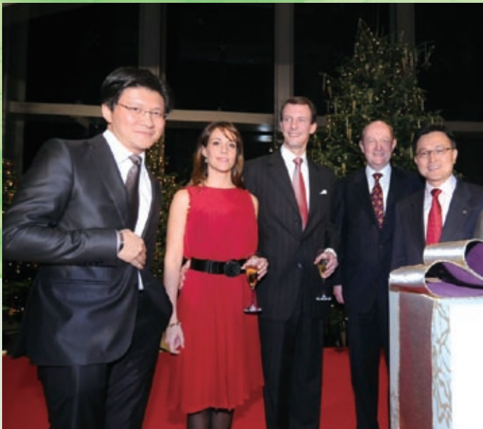
中銀香港全力支持「四季公益金閃耀人生」慈善聖誕籌款活動。