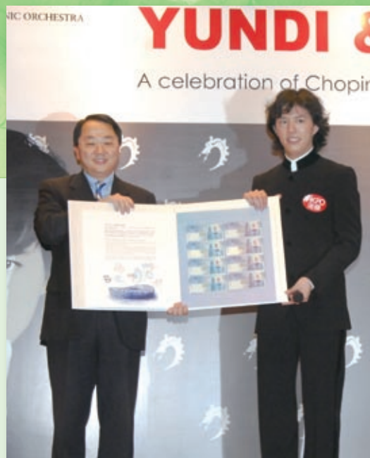
為慶祝蕭邦誕辰200週年，中銀香港為市民呈獻「港樂·李雲迪音樂會」。

本集團員工積極參與各種公益社會及義工活動，親身感受「助人自助」的喜悅。員工義務組織探訪長者、基層家庭互訪體驗、中秋義賣；前赴四川參加紅十字會送暖慰問；以及擔任「香港地質公園慈善環保行」的義務生態導賞員等，宣揚關愛社會的信息。