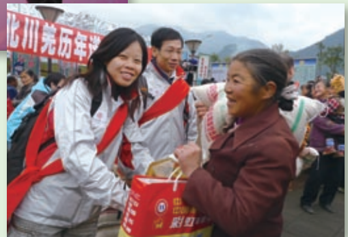
中銀香港義工隊遠赴四川參加由紅十字會舉辦的地震災區慰問活動。

幣1.53億元撥捐中銀香港慈善基金，用於支持香港的慈善公益事業，持續履行社會責任。另港幣5,000萬元撥捐香港公益金，資助公益金屬下會員機構。中銀香港亦因此榮獲由香港公益金頒發的2008/2009年度「超卓貢獻大獎」及「香港公益金四十週年慈善家大獎」，以表揚我們關愛社會的企業精神。