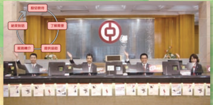
我們十分重視員工培訓，鼓勵員工持續學習，自我增值。