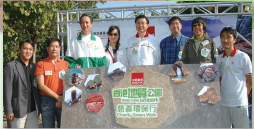
中銀香港首創的「香港地質公園慈善環保行」，宣揚珍惜資源的訊息，深受廣大市民、客戶及員工歡迎。

2009年6月，我們參加了地球之友「夠照·熄燈」行動，並簽署全港首份《夠照·熄燈》約章，在節能減排、減少光污染及光滋擾方面作出公開承諾。