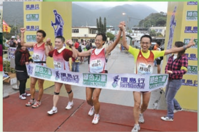
中銀香港員工勇奪「綠色力量環島行」銀行盃賽50公里及25公里賽雙冠軍。

年內，甲型H1N1型流感病毒在本港構成威脅，本集團即時採取多項預防措施，加強防疫。除了向員工發送「健康關懷心意包」，更為員工提供流感疫苗的注射服務，增強員工的抵抗力。為體現關愛員工精神，本集團更為員工提供免費身體檢查服務。本集團一向致力為員工提供安全舒適的工作環境，加強辦公室及分行清潔，保障員工的健康。此外，為適應香港炎熱潮濕的天氣，我們在夏季制服的襯衣布料加入了防皺及排汗等特點，既體貼員工需要，也符合環保原則。