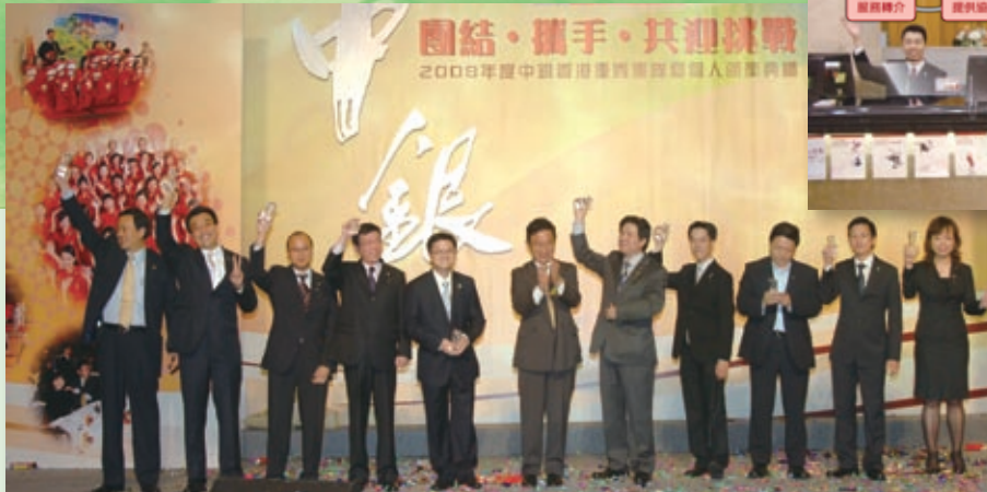
集團舉辦員工表彰晚會，表揚表現卓越的員工，振奮士氣。