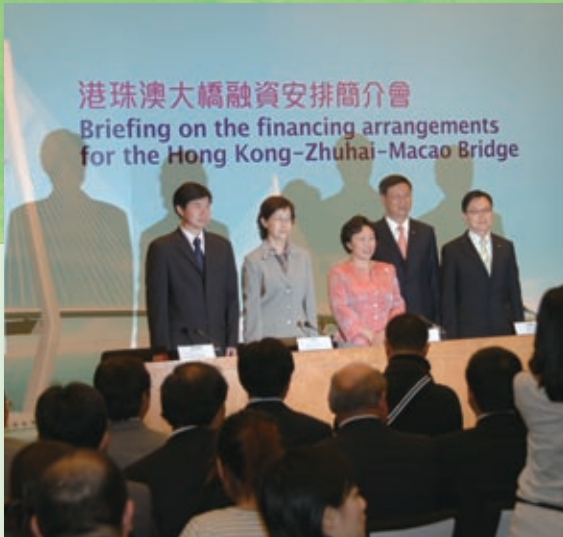
中銀香港協助中國銀行成為「港珠澳大橋」融資的獨家牽頭行。