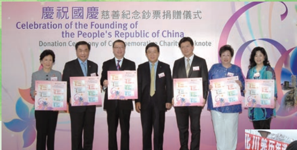
為慶祝國慶60週年，中銀香港捐贈60套特別號碼的珍藏鈔票予6家香港慈善機構。