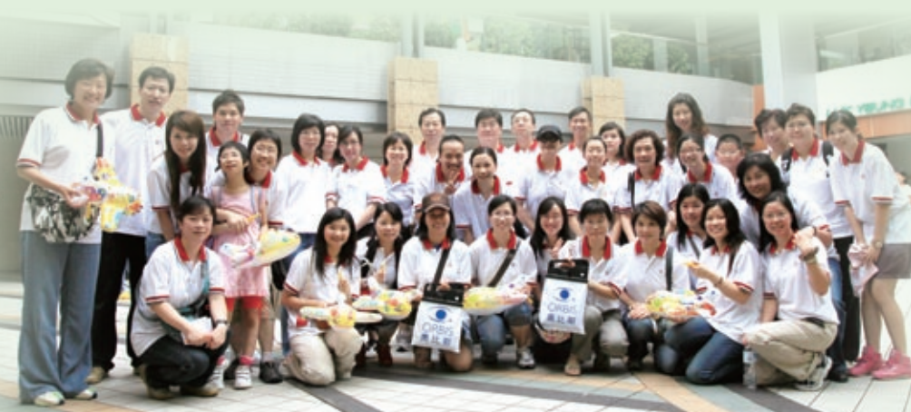
中銀香港義工隊積極廣泛參與多項香港及內地的義工活動。

我們全力支持2009年「公益金新界區百萬行」，主辦單位在當時即將通車的昂船洲大橋舉辦籌款活動。中銀香港員工和親屬以及客戶約1,200人，連同200多支來自工商機構、政府部門及社區團體的步行隊伍超過30,000人在當日共襄善舉。