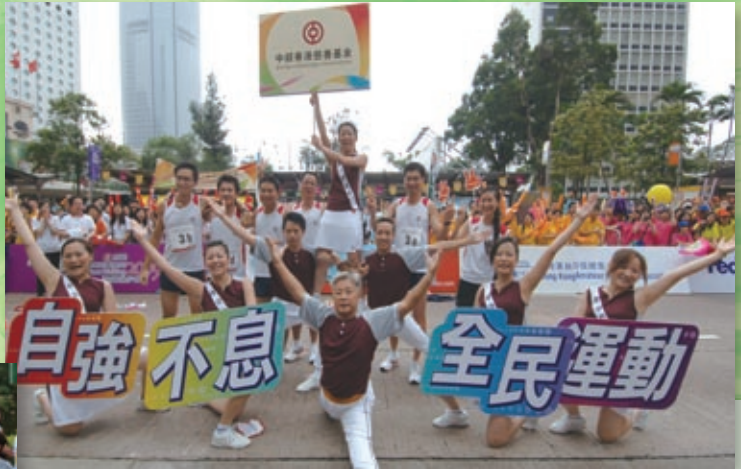
多元化有益身心的員工活動。