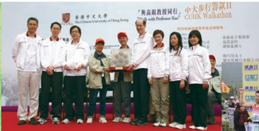
近500名本集團員工參加「與高錕教授同行」步行籌款，為認知障礙者籌款。