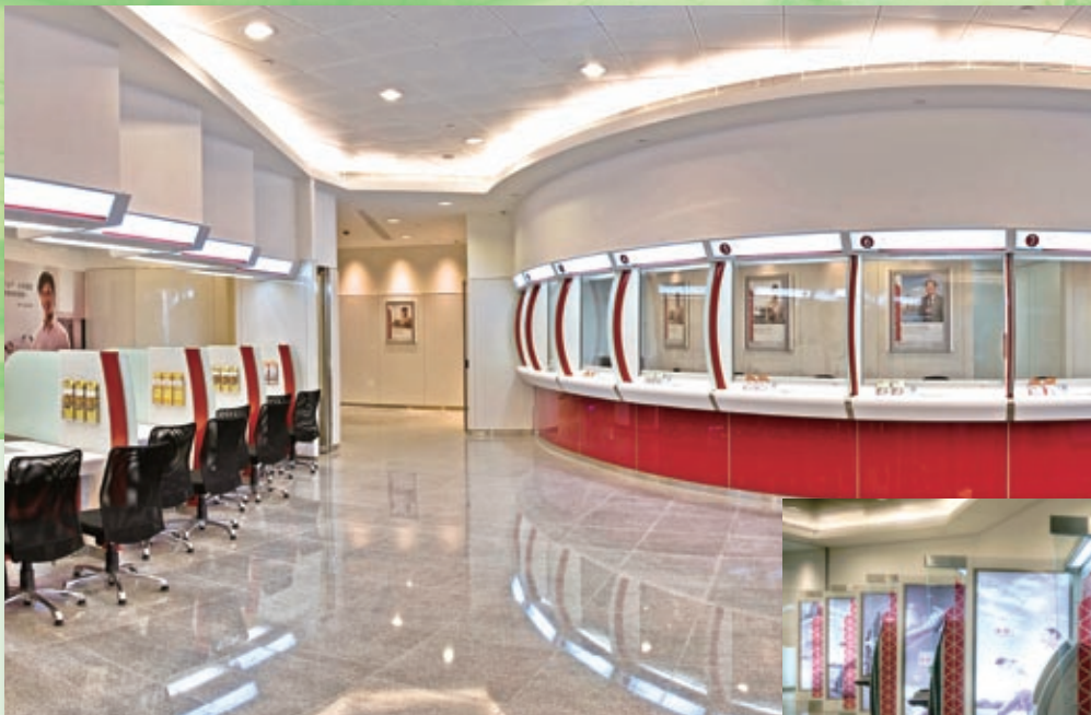
我們是全港擁有最廣泛分行網絡的銀行集團。圖為中銀香港荃新天地分行及自助銀行服務區，以活力動感的嶄新面貌展示我們進取創新的服務理念。