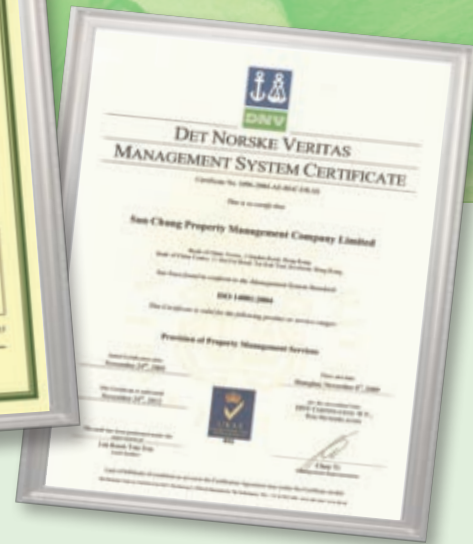
中銀香港推動環保不遺餘力，中銀大廈及中銀中心榮獲不少環保獎項。

減少約285萬千瓦時，排放的二氧化碳減少逾1,700噸，節省電費每年逾港幣430萬元。