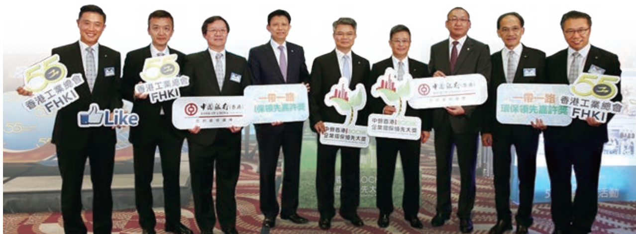
我們與香港工業總會合辦「中銀香港企業環保領先大獎」，鼓勵香港及泛珠三角從事製造業及服務業的公司推行環保措施，反應熱烈

我們深明健康的環境是經濟發展和社會進步的基石，並致力在日常營運中減少碳足跡，積極提倡對環境負責任的行為，同時與員工、供應商、客戶和其他利益相關者共同合作，推廣環保，以促進社會的可持續發展。