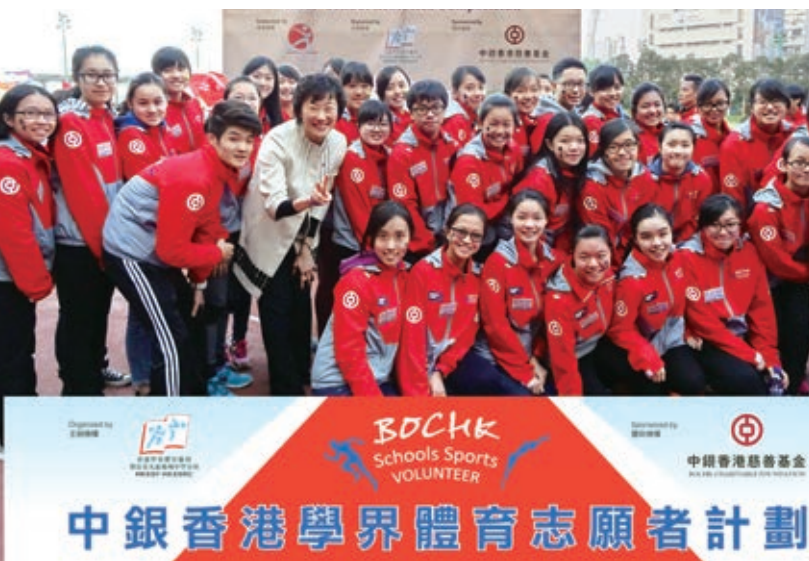
我們全力贊助學界體育盛事—「港九地域中學校際運動比賽」

集團支持多元化的文藝活動。年內，其中一項重點贊助是香港管弦樂團第42樂季揭幕音樂會《譚盾的女書》，吸引了超過3,000名觀眾；還有由香港藝術館協會舉辦、中銀香港私人銀行連續第三年贊助的「香港藝術館週」：在2015年11月其中的一個星期內，市民可於50多個本地畫廊免費參加講座和導賞等。此外，為推廣茶藝文化，我們連續五年贊助了香港貿易發展局的「茶緣雅敘」活動。