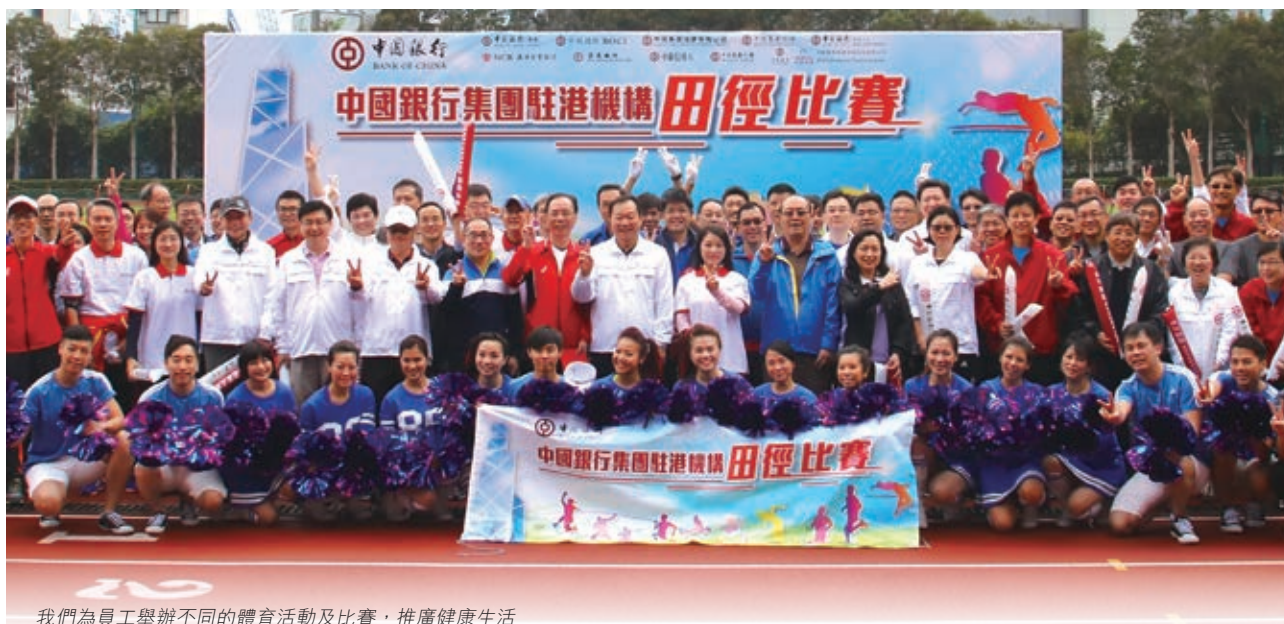
我們為員工舉辦不同的體育活動及比賽，推廣健康生活

為確保人才發展計劃符合集團的業務策略，我們建構了「領導力模型」及「基本才幹模型」，分別針對具備領導職能及非領導層的員工釐訂有效的才幹標準，為員工提供明確的個人發展目標，也成為集團招聘人才及考核員工表現的基礎。透過結構性的事業發展與培訓課程，我們確保員工能夠有效掌握所需的知識及技能，協助他們發展個人事業。