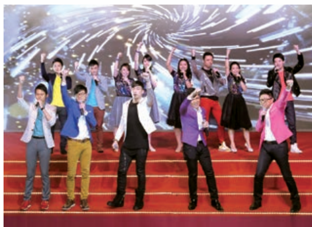
員工團結一致，共同建設美好的中銀大家庭

2015年，他們聯同家人和朋友參加了136個活動，服務兒童和青年、長者、有特殊需要的殘疾人士，以及環保活動；也參與「香港銀行公會」舉辦的教育活動，另