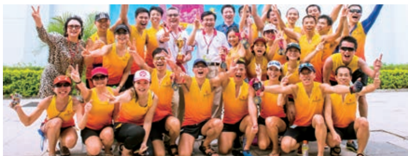
集團為員工舉辦多元化的康樂活動