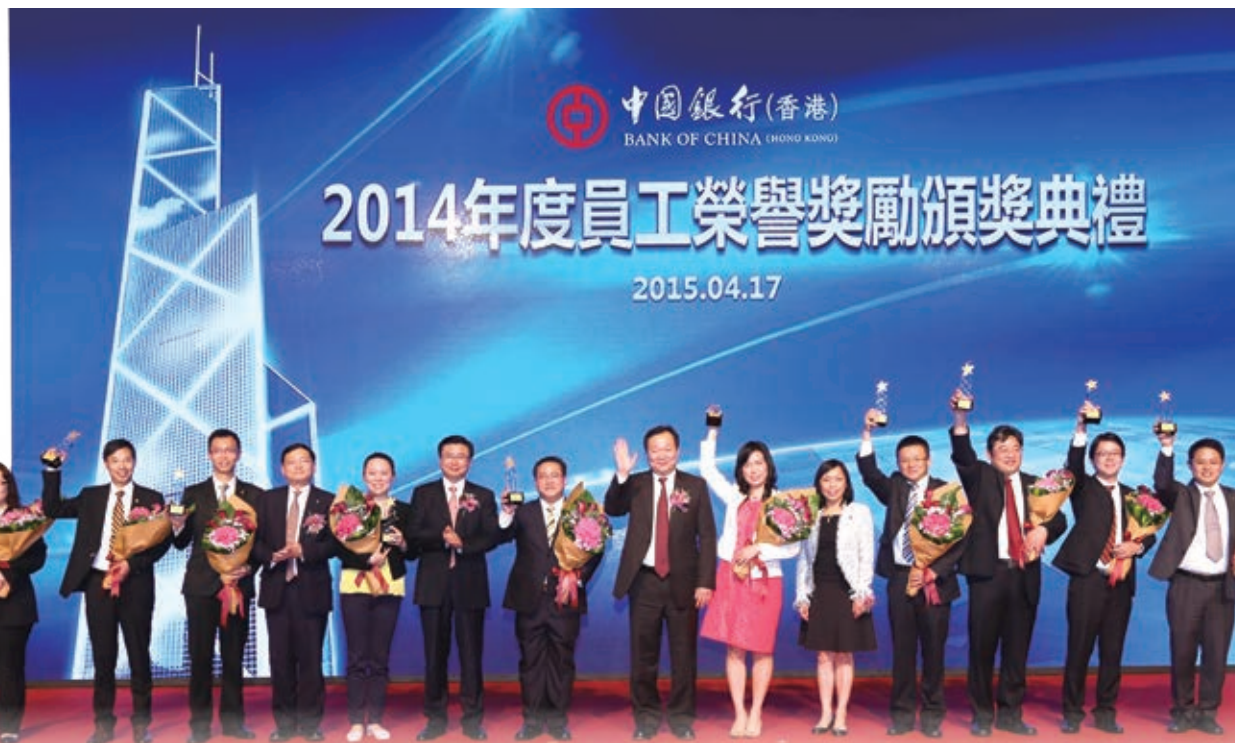
我們每年舉行大型頒獎禮嘉許表現優秀的業務團隊及人員