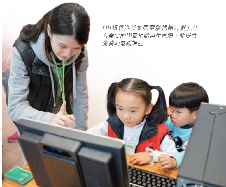
「中銀香港新家園電腦捐贈計劃」向有需要的學童捐贈再生電腦，並提供免費的電腦課程