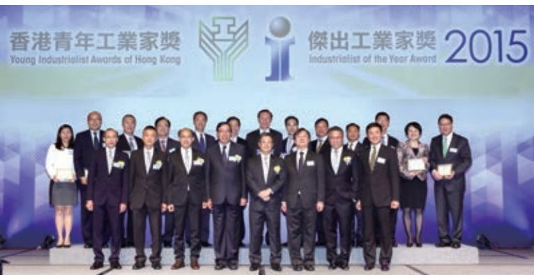
我們積極支持香港工業總會主辦的「香港青年工業家獎暨傑出工業家獎」，表彰傑出的工業家

此外，我們贊助了「香港青年工業家獎暨傑出工業家獎」及「香港工商業獎」，以表彰對本地經濟發展有貢獻的工業及製造業界精英。