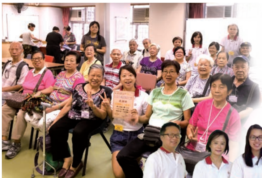
約有1,400名員工加入「中銀香港愛心活力義工隊」，服務兒童和青年、長者、有特殊需要的殘疾人士，以及參與環保活動等