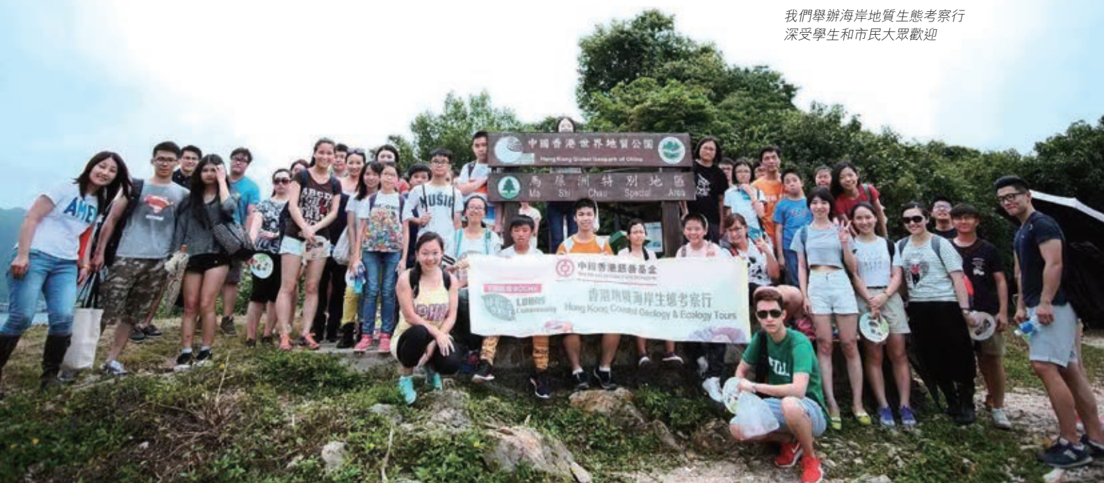
我們舉辦海岸地質生態考察行 深受學生和市民大眾歡迎