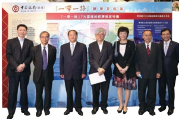
我們舉辦「一帶一路」講座，邀請專家為中小企、商會會員及員工等介紹有關政策機遇

「中小企一站通支援中心」，向中小企提供有關市場趨勢、科技發展及融資等的最新資訊。我們還組織中小企及內地企業業務洽談會，促進其跨境業務投資、技術交流及貿易合作。集團對中小企的長期支持，備受肯定，連續八年榮獲由香港中小型企業總商會頒發的「中小企業最佳拍檔獎」。