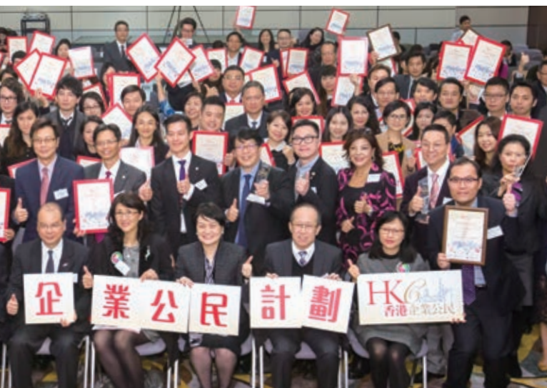
集團連續六年贊助香港生產力促進局的「香港企業公民計劃」，鼓勵企業履行及推動企業社會責任

此外，我們贊助由醫院管理局中樂團主辦的「2014/2015 杏林樂韻表關懷」計劃，在多家公立醫院舉辦一系列的節日關懷音樂會及中樂治療工作坊，透過音樂向逾3,800名長期病患的院友、醫護人員和社區長者送上關懷祝福。