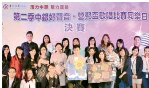
中銀好聲音歌唱比賽在美妙歌韻下圓滿完成，比賽吸引超過100名參賽者