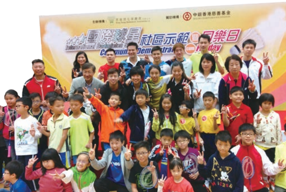
我們在社區和學校向基層人士推廣羽毛球運動