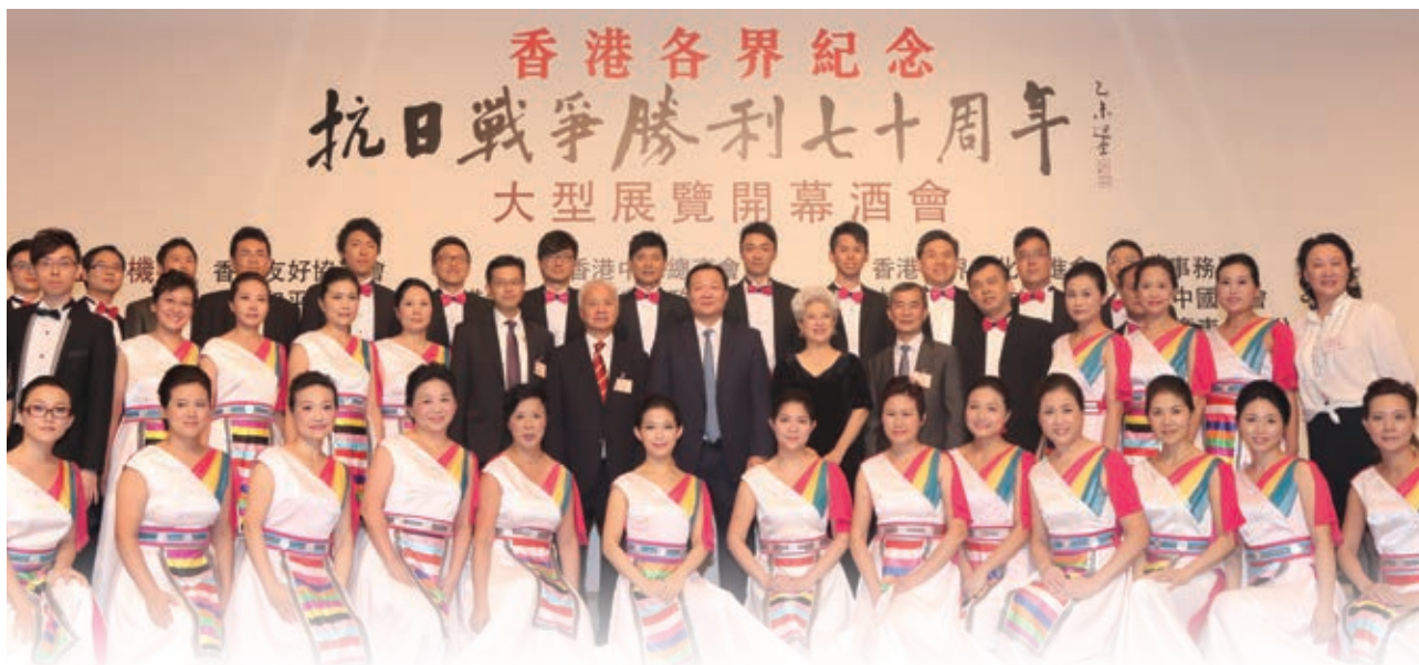
中銀香港合唱團歌藝精湛，勇奪2015亞洲國際合唱團銀獎，亦獲邀參加多項公開表演活動