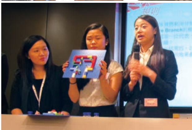
我們為大學畢業生提供「見習管理人員培養計劃」及「優秀大學畢業生培養計劃」，培育人材