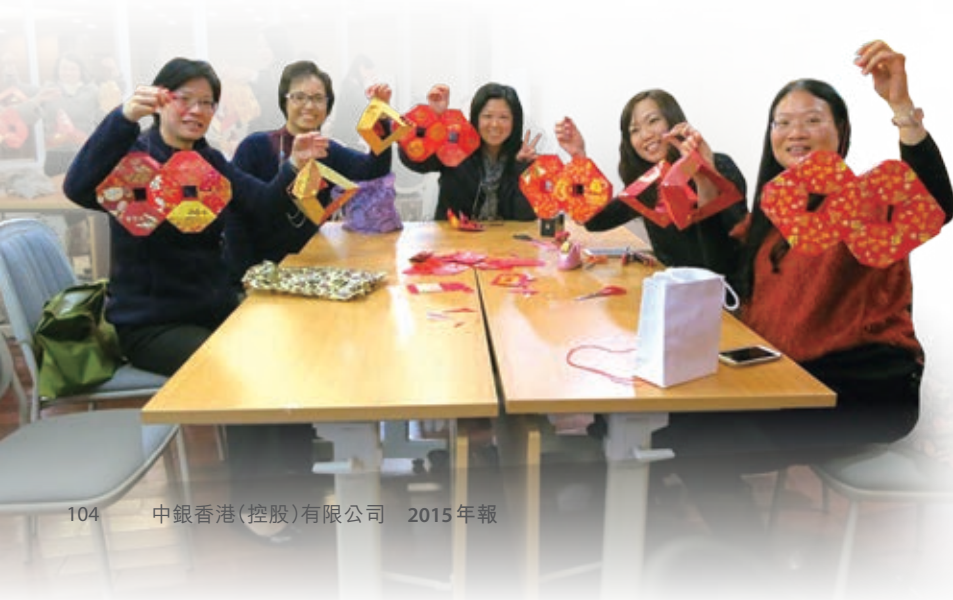
我們連續三年贊助由綠領行動舉辦的「利是封回收重用大行動」，並為員工舉辦利是封掛飾工作坊，鼓勵循環再用