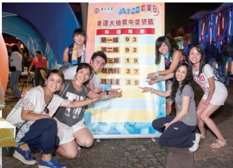
超過28,000名員工及其親友參加了在香港海洋公園舉行的員工同樂日，盡慶而歸