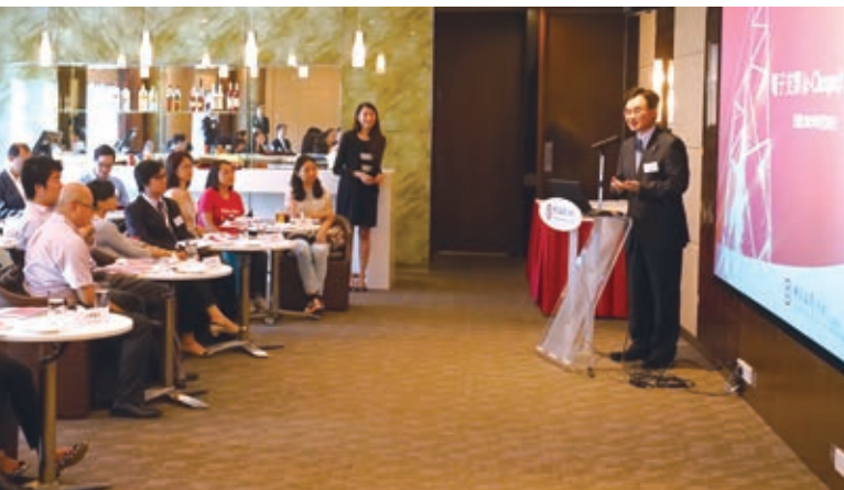
我們為多間慈善機構舉辦電子支票使用介紹會，推動金融服務電子化，支持環保

集團與香港工業總會攜手設立「中銀香港企業環保領先大獎」，旨在鼓勵香港及泛珠三角洲從事製造業及服務業的企業進行環保措施，減少環境污染。該計劃更特設「一帶一路環保領先嘉許獎」，頒發予在「一帶一路」沿線地區推行環保措施的傑出企業。計劃吸引了逾450家企業參加，反應熱烈。