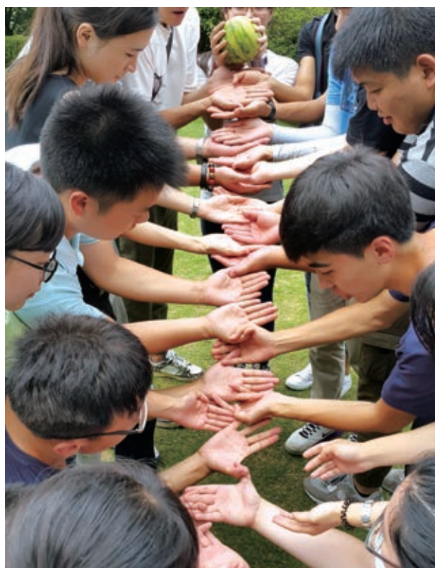
我們贊助多元化的環保活動和工作坊，向青少年宣揚保護環境的訊息

在2015年，中銀集團人壽贊助了由香港聖公會福利協會主辦的「健康工程師計劃」及香港家庭福利會主辦的「『童』步成長路計劃」，為逾8,000名來自本地小學的