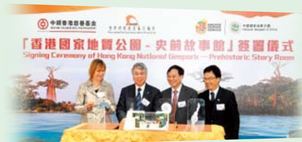
位处中银大厦的「史前故事馆」展出近100件珍贵的古生物化石及模型展品，让市民也可以在闹市走进世界级的地质公园

我们在2011年独家赞助由渔农自然护理署及香港岩保会合作推出全球首个「世界地质公园网上教室」，邀请