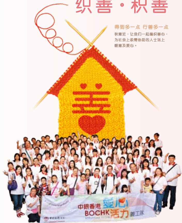
中银香港爱心活力义工队参与多项社区及慈善活动，积极宣扬关爱社会的讯息

得到多一点 行善多一点 秋意近，让我们一起编织善心， 为社会上极需协助的人士送上 暖意及爱心。