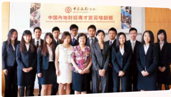
我们举办「中国内地财经专才实习计划」，让本港大学及大专生到中国银行内地分行实习

羽毛球是「基金」连续13年重点发展的体育项目，累计投入支持香港发展羽毛球运动的资源逾港币1,200万元，惠及逾80万名参加者。「羽毛球发展及培训计划」内容多元化，包括「亲子乐Fun Fun」羽毛球双打比赛，吸引逾1,600人次参与，同时亦将同乐日扩展至港岛东区、中西区、九龙深水埗及油尖旺区、新界天水围等举行，市民反应热烈。有关计划下的「全港羽毛球锦