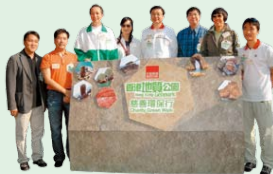
中银香港自2009年首创的「香港地质公园慈善绿步行」，深受市民欢迎

2009年起，我们连续第2年参加了由世界自然基金会主办的「地球一小时」，以行动唤起全球对气候变化的关注。我们签署了全港首份《够照·熄灯》约章，在节能减排、减少光污染及光滋扰方面作出公开承诺。此外，我们自2009年已在公司宴会中停止采用鱼翅、濒危珊瑚鱼类及发菜等食材，减少对环境的破坏。为进一步支持保育鲨鱼及扭转全球鲨鱼数量急剧下降的趋势，本集团在2011年参与世界自然基金会香港分会的「鲨鱼保育计划」，签署承诺停止供应、采用鱼翅及推出与鱼翅相关的优惠。