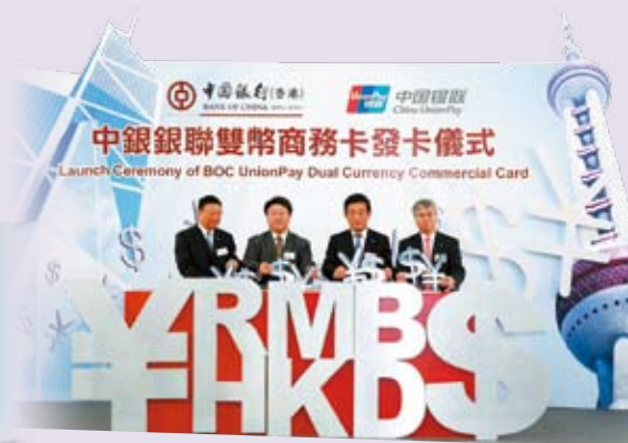
全新「中銀銀聯雙幣商務卡」为企业客户提供跨境理财及消费的便利

新的「境外银联卡缴费」服务，为需要跨境工作及生活的持卡人提供便捷的支付渠道。此外，全新推出的「银联双币借记卡」服务，让客户享受更全面的双币现金提款及消费服务。