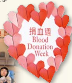
本集团与香港红十字会输血服务中心合办「齐捐血·显爱心」活动，得到集团员工和市民大众的积极响应