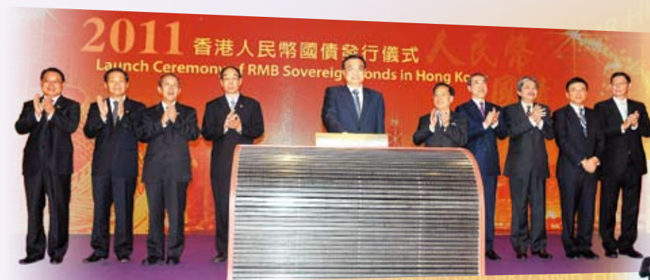
中华人民共和国国务院副总理李克强先生出席主礼 「2011香港人民币国债发行仪式」