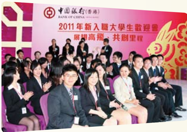
我们定期举办新入职大学生欢迎会，让新入职员工了解银行概况及业务发展