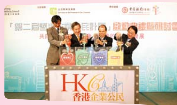
我们连续两年赞助了由香港生产力促进局主办的「香港企业公民计划」，促进社会的可持续发展

中银香港连续两年冠名赞助由香港公益金主办的「慈善高尔夫球赛」。来自各企业和团体的高球好手组成队伍为慈善挥杆，2011年成功筹得逾港币180万元，全数捐助公益金提供精神病支援及复康服务。此外，本集团参与了「苗圃行动」在5月举办的慈善高尔夫比赛，邀请企业客户组队支持，活动共筹得港币63万元，用于内地偏远山区的中小学重建项目。