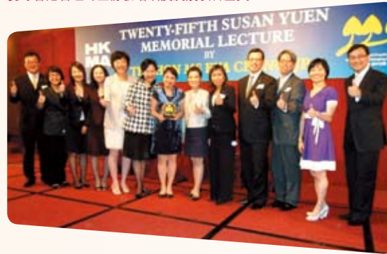
中银香港凭「一切由心出发—客户服务大使培训及发展计划」勇夺香港管理专业协会培训及发展项目金奖