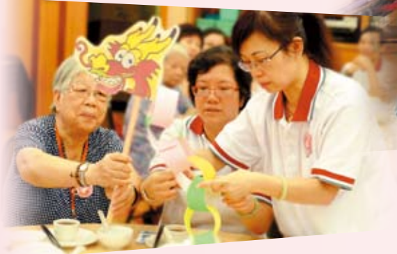
中银香港爱心活力义工鼓励长者参与健脑活动，一同制作手工艺

2010年3月，中银香港组织500名员工及客户携手参与香港中文大学举行的「与高锟教授同行」中大步行筹款日，为认知障碍者家属培训课程及高锟奖学基金筹募资金。此外，我们自2010年起连续两年与香港小童群益会合办「童心传爱－Kids and Kiss计划」，向来自基层家庭及寄住家庭的儿童表达关爱讯息。