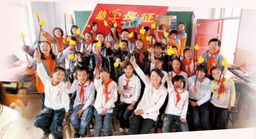
爱心无界限，我们助学步行队前往甘肃成县探访当地小学生

我们亦积极向内地传递关爱之情，继2009年参与「苗圃行动」的「512助学行」及「助学长征」筹款活动后，中银香港9名员工暨家属组成名为「Team One添温」助学步行队，参与2010年度「苗圃512甘肃第8段成县段」助学行，用4天时间完成近60公里的路程，筹得善款逾港币11万元，并为学生举行「创意课堂」活动，致力发扬「关爱社会」的精神。