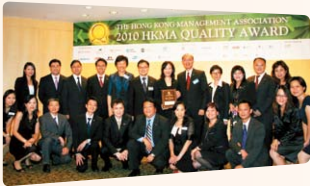
中银人寿凭优质服务，满足客户多元化的理财需要，荣获香港管理专业协会优质管理银奖