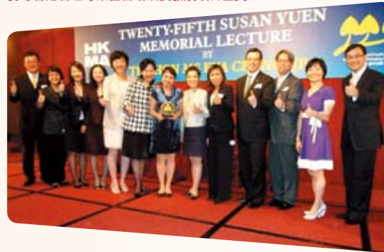
中銀香港憑「一切由心出發——客戶服務大使培訓及發展計劃」勇奪香港管理專業協會培訓及發展項目金獎