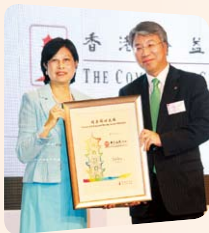
香港公益金向中銀香港頒發2011年首創的「同善同心大獎」，以表揚我們致力履行企業社會責任