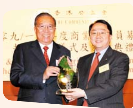
我們大力支持本地慈善事業，榮獲香港公益金2010年度「超卓貢獻大獎」