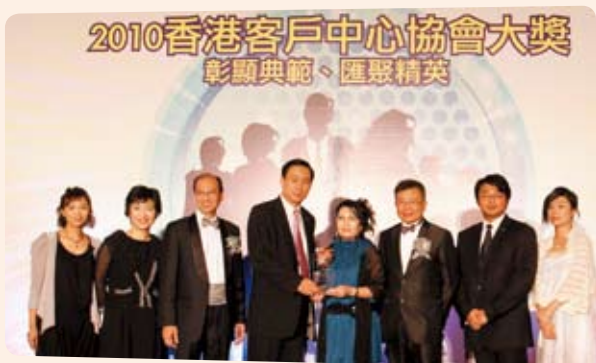
中銀香港電話服務中心榮獲「2010香港客戶中心協會大獎」 兩個企業項目及11個個人項目獎項