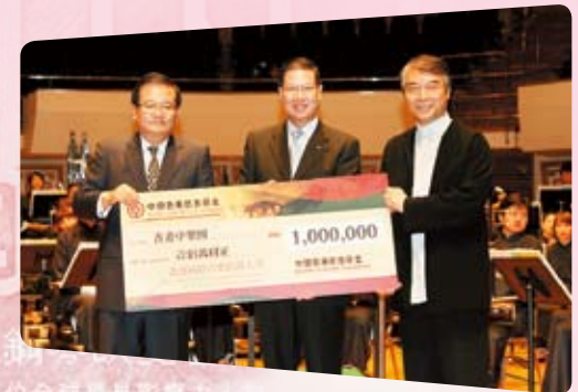
中銀香港向香港中樂團頒贈港幣100萬元支票，支持「香港國際中樂指揮大賽」，弘揚文化藝術

2010年為紀念「蕭邦誕生200週年」，「基金」贊助了「港樂·李雲迪音樂會」，安排近100名中銀香港客戶、員工及家屬參加「李雲迪鋼琴大師班」。2010年，我們贊助了香港管弦樂團與郎朗合作的「中國之子」音樂會，並舉行籌款晚會，超過2,000名觀眾欣賞了郎朗的動人樂章。