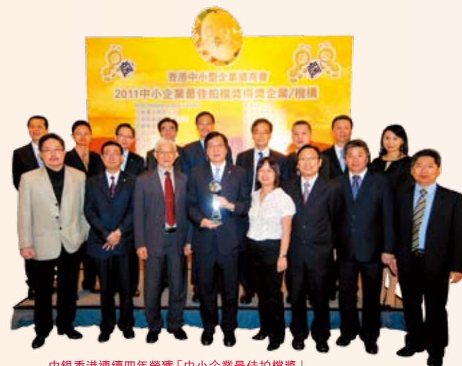
中銀香港連續四年榮獲「中小企業最佳拍檔獎」