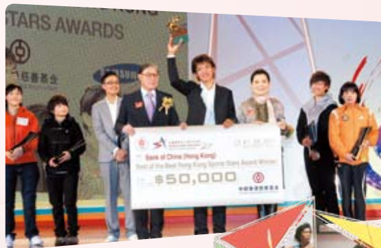
我們已連續5年全力支持「中銀香港傑出運動員選舉」，以表揚本地運動員的優秀表現