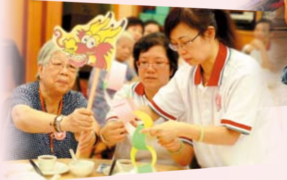
中銀香港愛心活力義工鼓勵長者參與健腦活動，一同製作手工藝

2010年3月，中銀香港組織500名員工及客戶攜手參與香港中文大學舉行的「與高錕教授同行」中大步行籌款日，為認知障礙者家屬培訓課程及高錕獎學基金籌募資金。此外，我們自2010年起連續兩年與香港小童群益會合辦「童心傳愛－Kids and Kiss計劃」，向來自基層家庭及寄住家庭的兒童表達關愛訊息。