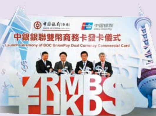
全新「中銀銀聯雙幣商務卡」為企業客戶提供跨境理財及消費的便利

新的「境外銀聯卡繳費」服務，為需要跨境工作及生活的持卡人提供便捷的支付渠道。此外，全新推出的「銀聯雙幣借記卡」服務，讓客戶享受更全面的雙幣現金提款及消費服務。