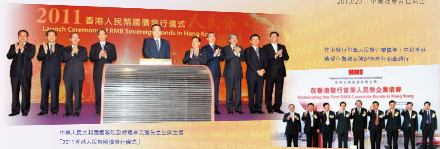
中華人民共和國國務院副總理李克強先生出席主禮 「2011 香港人民幣國債發行儀式」