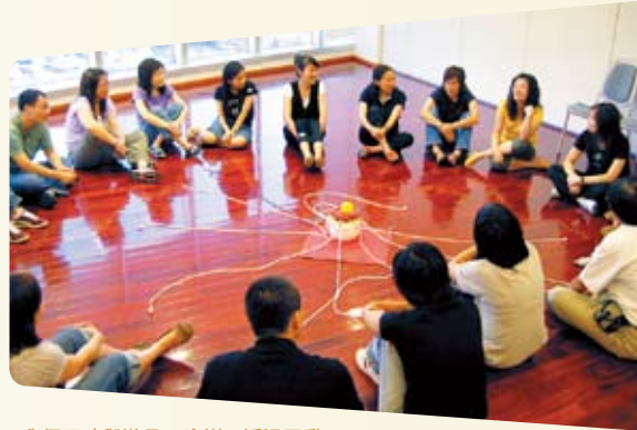
我們不時舉辦員工培訓，透過互動創新的活動建立及鼓勵團隊精神