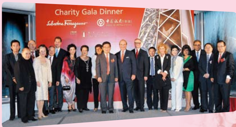
中銀香港與 Salvatore Ferragamo 兩大品牌攜手合作， 糅合創新藝術與慈善活動，口碑載道

自2010年起，中銀香港連續兩年贊助由香港生產力促進局舉辦的「香港企業公民計劃」，以「共同促進經濟、社會、環境的可持續發展」為題，鼓勵企業建立公民責任價值觀，將之融入營運策略和管理措施，藉此推廣至企業員工及其家人、客戶、學生，以至公眾。透過舉辦比賽、研討會、工作坊及頒發「香港傑出企業公民獎」，讓企業在每一範疇竭其所能，服務社會；並特別增設以學生為對象的「企業公民活動計劃書創作比賽」及「香港企業公民」海報設計比賽，加強年青一代對企業公民責任的認知及關注。