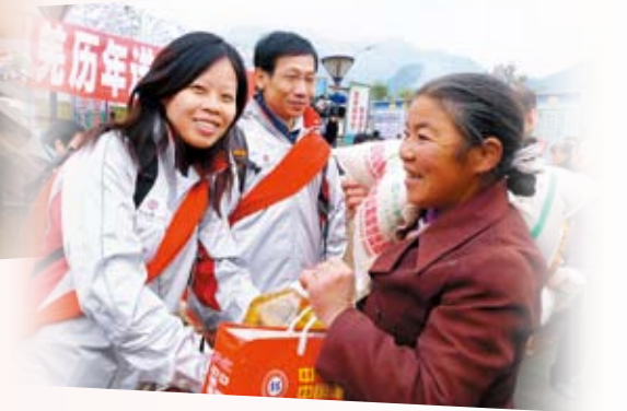
中銀香港愛心活力義工隊遠赴四川參加由香港紅十字會舉辦的地震災區慰問活動

進知識。該行因此在內地著名國家級大型期刊《首席財務官》雜誌主辦的「2010年中國CFO最信賴的銀行評選」中，獲得「最佳社會責任獎」。