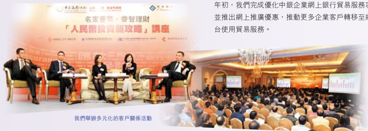
我們舉辦多元化的客戶關係活動

此外，本集團一直貫徹「一切由心出發」的服務理念，透過不同形式的調查研究、舉辦研討會、拜訪公司客戶，以便了解客戶對服務的意見，不斷完善服務質素。集團電話服務中心及中銀信用卡公司憑藉優質服務及穩定的服務平台，2010年獲香港客戶中心協會頒發共15個獎項，包括電話服務中心獲「最佳呼入客戶中心(50席以下)」金獎，兩個單位同獲「神秘客戶撥測大獎」金獎。中銀信用卡公司亦自2008年起獲得香港品質保證局對顧客服務標準(ISO10002投訴管理體系)的認證，顯示其服務達至世界認可標準。