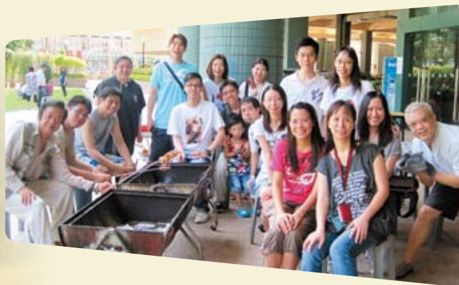
我們鼓勵員工工作息平衡，並舉辦不同類型的康體活動，讓員工及家屬一起參與