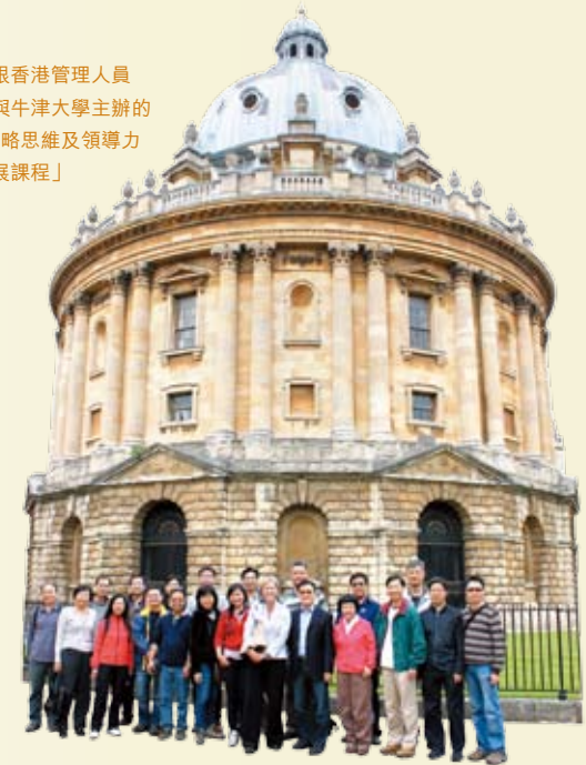
中銀香港管理人員參與牛津大學主辦的「策略思維及領導力發展課程」

為提高本集團人員的專業性，我們重點推出崗位序列培訓，崗位包括分行主管、營運經理、櫃員、客戶服務人員及理財人員等。配合業務發展需要，我們推出一系列網上學習課程，讓銷售人員掌握新產品的特點及合規銷售須知。本集團並舉辦中介人持續專業培訓及證券業務主管人員培訓，以提升銷售人員的合規及業務知識，並為全體員工安排防洗錢培訓、風險管理制度及法規風險管理制度等網上培訓。