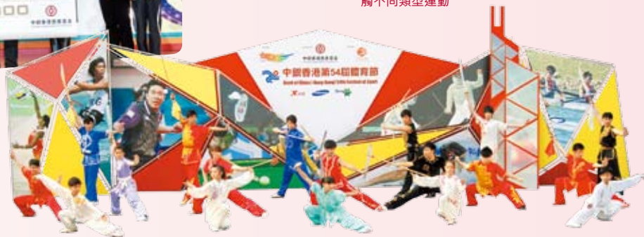
一年一度的「中銀香港體育節」掀起「全民運動」熱潮，讓市民有機會接觸不同類型運動

從小培養兒童的理財及環保意識至為重要。2010年，我們贊助了香港專業教育學院幼兒教育及社會服務系，於沙田新址設立「孩子天」綠色兒童銀行及「兒童小農莊」，讓小朋友透過多項意念新穎的遊戲和角色扮演，學習銀行的基本運作。此外，我們全力贊助「國際成就計劃 (JA) 小學課程2010」，透過有趣的活動教學，培育及啟發逾1,000名小學生，協助他們了解社會運作，培養他們積極的工作態度，為未來作好準備。