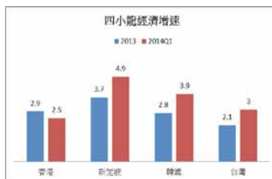
圖二：四小龍 GDP 增長率 (%)