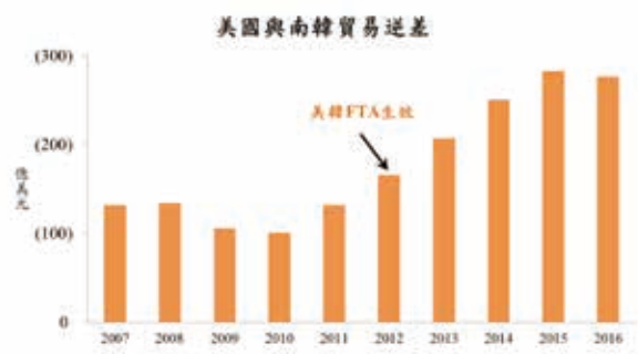
資料來源：U. S. Census Bureau，中銀香港經濟研究

大檢討。世界銀行數據顯示南韓及墨西哥經濟在全球的排名分別在第11位及第15位，可以預期NAFTA及美韓FTA的貿易條款在重談及檢視過程中將有所收緊，這對北美及亞洲區的貿易活動將有較大影響。