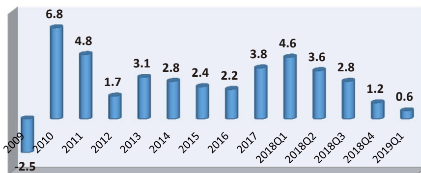
香港 2009 年以來 GDP 升幅 (%)

一是整體經濟出現超低速增長。繼去年第四季度GDP按年實質升幅降到1.2%之後，今年首季進一步跌至只有0.6%，為十年來的最差表現，且已接近衰退的邊緣。在過去三十年，如此之低的經濟增長，僅在1997年亞洲金融風暴猛擊香港、2001年全球資