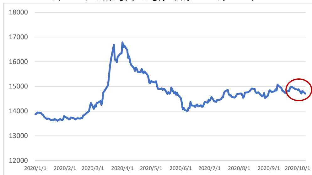
圖1：印尼盾兌美元走勢（截至10月9日）

年初至今印尼盾兌美元貶值逾5.88%，跌幅有所收窄，但印尼盾仍是東南亞表現最差貨幣。雖然印尼盾在9月份呈現下跌趨勢，但法案通過後印尼盾匯率反而小幅上升。截至10月9日兌美元單月微升1.5%（圖1），主要因美元指數走弱的影響，未來美元指數波動性增加，對印尼盾等新興市場貨幣匯率的影響也會增大。目前市場對於印尼示威帶來的影響持觀望態度，若示威持續惡化，加上本地疫情以及對印尼央行獨立性的態度等因素，印尼盾貶值趨勢可能再現。