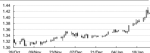
資料更新至: 26-01-2018

▲ 走勢 ：英國財政大臣哈蒙德表示英國經濟正從脫歐衝擊中回復，通脹已觸頂，預期通脹將回落，英鎊於近日升值較快，但兌歐元仍穩定，他樂見現時英鎊匯率。英鎊週四曾升穿1.43水平，但及後因美元反彈，收盤報跌。現報1.4150。