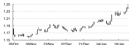
資料更新至: 26-01-2018

▲ 走勢 ：歐央行議息決定維持貨幣政策不變，且未有修改前瞻性指引。但行長德拉吉表示，歐元區經濟擴張程度較預期為快，有信心通脹向目標水平靠攏。歐央行未有發表打壓歐元言論，令歐元曾於昨晚大幅抽高，惟尾段下跌，現報1.2390。