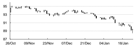
資料更新至: 26-01-2018

▲ 走勢 ：美國財政部長努欽週四表示政府不擔心美元短期匯率走勢，令美元一度跌穿89水平，但隨後美國總統特朗普表示，美元匯價將隨著美國經濟增長而持續走強，而他希望美元匯價強勁，刺激美元由三年低位回升。現報89.391。