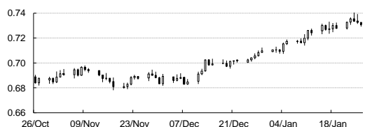
資料更新至: 26-01-2018

▲ 走勢 ：紐西蘭第四季度消費物價指數按季上升0.1%，較預期及前值0.4%及0.5%低，按年升1.6%，同樣較預期及前值1.9%低，通脹進一步偏離央行1%-3%通脹目標中值。美國總統特朗普週四表示看好美元，紐元續跌，現報0.7322。