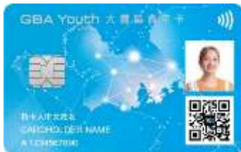
大灣區青年卡(中銀卡)