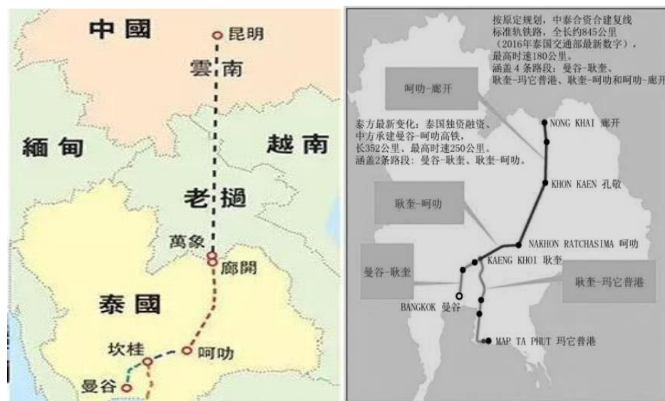
泰國交通部最新有關中泰鐵路規劃示意圖

但變局再出現在今年3月24日，泰國宣布了將先修建曼谷-呵叻綫路（為原本路綫從曼谷到廊開總長860公里的1/3），新規劃是出于考慮現實泰國內部政治，資金和物力等在力所能及範圍內做出的調整決定。